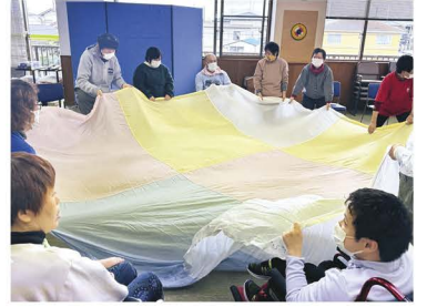
ミュージックケア講座の様子

楽しみながら健康づくりや交流を深め、仲間同士のつながりを広げる講座です。どなたでも気軽にご参加ください。