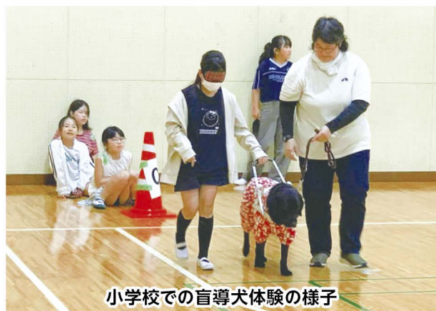
小学校での盲導犬体験の様子