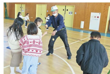
高齢者クラブ会員による 伝承活動の様子