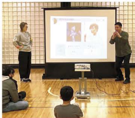
ジェスチャーを交えながらの講話

1月24日、市総合体育館サブアリーナにて、小学5・6年生向け体験会「コミュニケーションゲームDENSIN」を開催しました。この体験会は、障害者理解促進事業として、聴覚障害に対する理解を深めるために実施し、12名の児童にご参加いただきました。