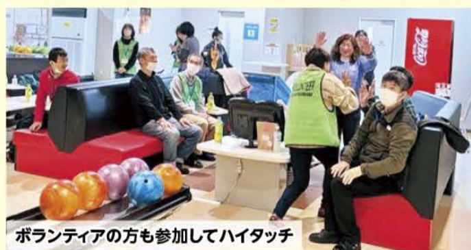
ボランティアの方も参加してハイタッチ

当日は、各団体から64名、そして大会運営を支えてくださったボランティア4名が参加し、にぎやかに開催されました。