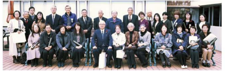
受賞された皆さん

ひたちなか市からは、茨城県知事表彰21名、茨城県社会福祉協議会会長表彰34名、茨城県共同募金会会長表彰1名の方々が受賞いたしました。