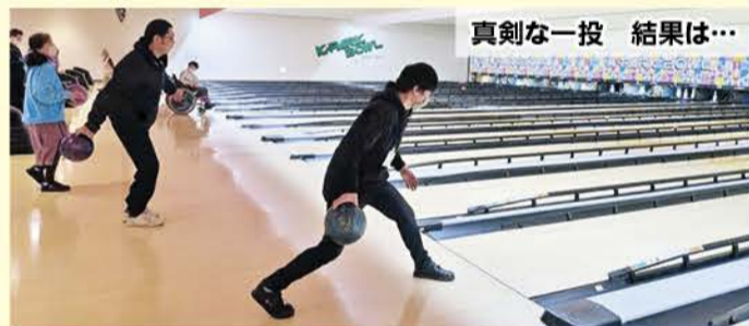
真剣な一投 結果は...