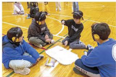
ジェスチャーで伝え中!

参加した児童からは、「ピザの具材でチーズの伸びる動きはわかりやすいけど、トマトを表現するのは難しかった。」「相手の伝えたいジェスチャーが分かった時は嬉しかった。」などの声が聞かれ、言葉以外の方法で、心を通わせる大切さを学ぶ貴重な機会となりました。