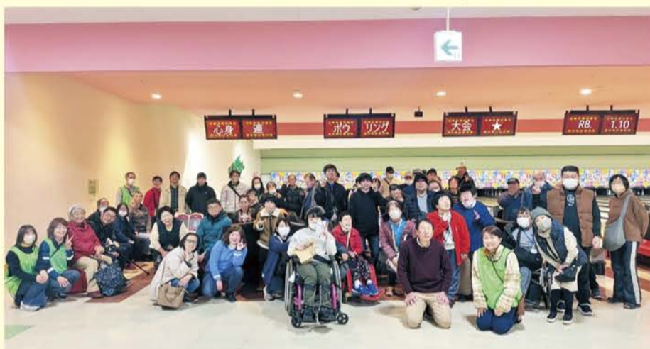
参加された皆さん

この大会は、会員同士の親睦と交流を目的として、ボランティアの皆さんの協力のもと毎年、勝田パークボウルで開催しています。