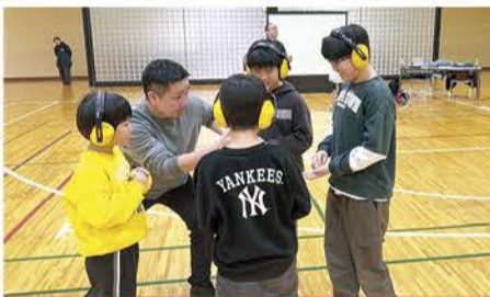
イヤードیفンダーをつけて聴覚障害体験