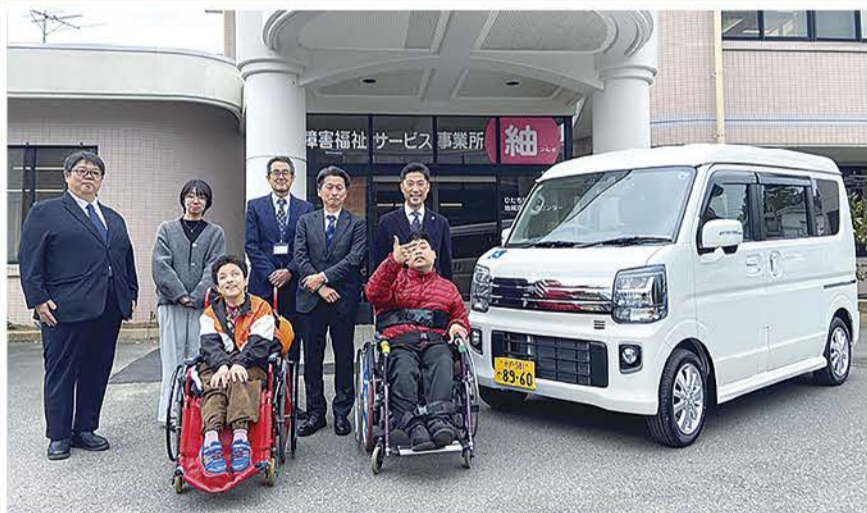
寄贈車両を囲んで

このたび、ロジスティード東日本株式会社様の地域貢献活動を目的とした「まごころ基金」より、車いすのまま乗降できるリフト付き軽自動車ミニバンの寄贈を受け、3月2日にひたちなか市社会福祉協議会において寄贈式を執り行いました。