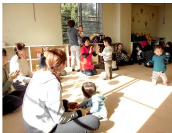
▲お母さんやスタッフと手遊び

まずは、自分達が笑顔で接することです。 笑顔の人は、もっと“えがお”に。笑顔でなかつた人も帰る時には、きっと“えがお”に。