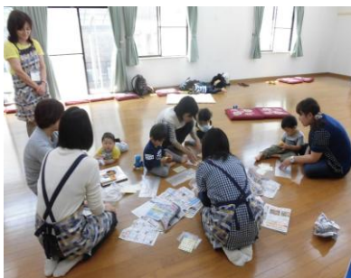
▲シールをバタバタ貼って遊びました

子ども達と遊びながら、親同士のコミュニケーションを深め、子育ての悩みの聞き手となったり、子育ての各種情報提供をしています。