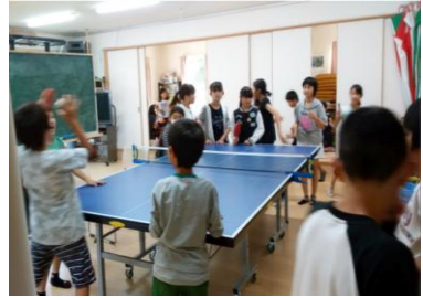
▲長松子ども館はいつも賑やか！

広い長堀公園内にある長松自治会倶楽部を利用し、自治会として子育て支援を行っています。子ども達の友達との遊び場提供、不定期で講習会なども開催しています。