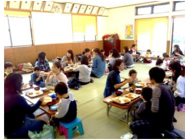
▲みんなと一緒に昼食を食べます