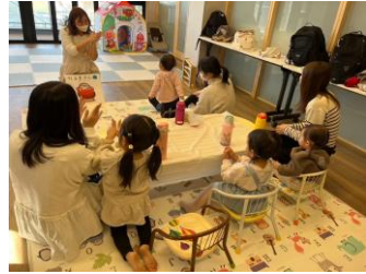
▲ 読み聞かせの時間です♪

“親子で一緒に居られる時間”を大切にしたい。 気軽に遊べる場所 居心地が良くホッとできる場所 子育ての楽しさや大変さを共有できる場所 そんな場所をつくりたいという思いから出来た サロンです。