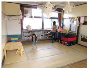
▲ひたちなか子どもふれあい館は 自由にみんなで遊べます

子育て支援を目的に地元の自治会や子ども会、高齢者クラブや民生委員の他、多くのボランティアの方達で運営しています。