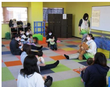
▲おもちゃの時間以外も内容盛りだくさん！

予約不要・参加費なし。誰でも気軽に入って下さい。子供たちを自由に遊ばせながら周りの人と交流し、お友だち作りしましょう。