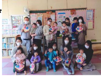
▲みんなでおひなさまを作りました

子育て中のお母さん、てまりは、月4回児童館で開いています。いつでも自由に出てきてみてね。良かったらまた来てね。ゆっくりと楽しいことを見つけていきましょう。