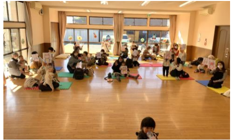
▲節分に足形アートをしました