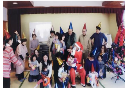
▲クリスマス会にサンタさんが登場！

みなさんの子育てを応援しています。 みんなで待ってるよ～！当日飛び込みOKです。