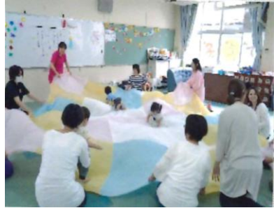
▲みんなで一緒に楽しんでいます