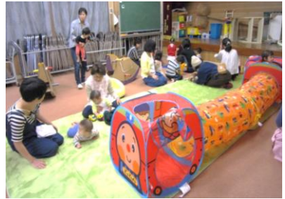
▲手作りの遊具もあります

参加者を地域限定にせず、いつでも受け入れています。各月、出前保育を受けていて、みんなで楽しい歌や親子ふれあい遊びを行っています。参加費無料で、おやつもあります。