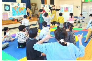
▲英語を使った遊びにワクワク！

各回ごとにテーマを決めて工作をしたり、レクリエーションではゲームをしたり読み聞かせをしています。おやつ時間では手作り菓子をみんなでいただきます。大人の方には、飲み物も用意してママ同士のホッとできる時間も大切にしています。