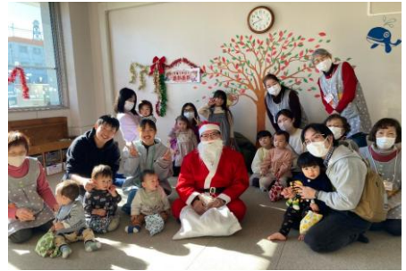
▲クリスマス会の集合写真です

誰でも気軽に参加でき、親子が楽しめる地域のたまり場、子ども同士の遊び場、子育ての悩みや育児ストレスを解消する場となるよう心がけています。