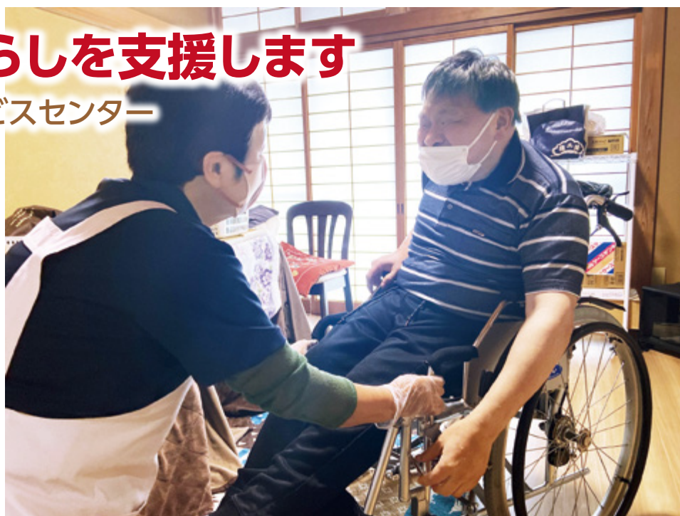
▲コミュニケーションを大切に活動しています。

当初と比べると、世の中の状況は大きく変わっていますが、当センターはこれからも変わらず、利用者の皆さんが住み慣れたご自宅で自立して生活していけるよう、暮らしのお手伝いを行っていきます。