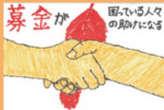
けんしんさん (学生)