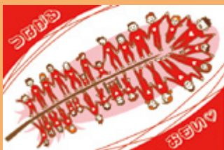
ようへいさん (一般)