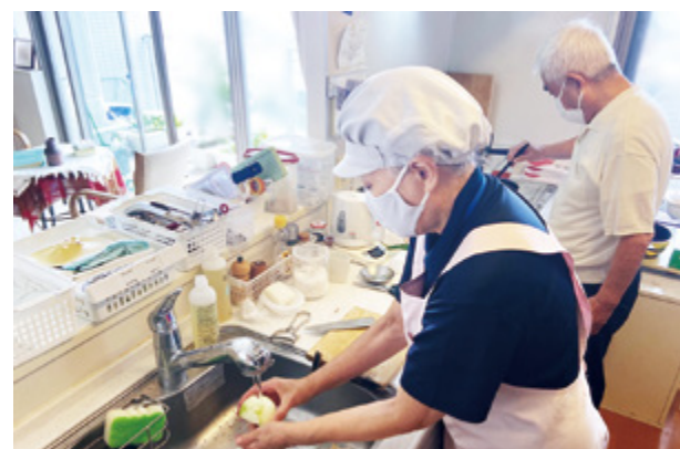
▲つくる楽しさを、いっしょに